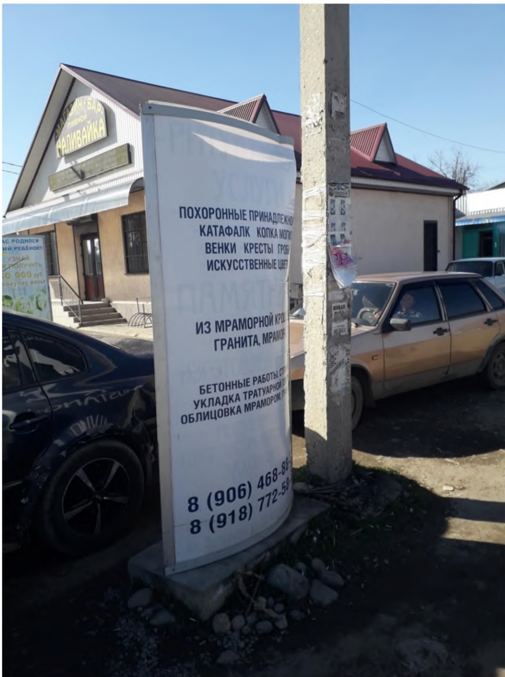
Фотографии рекламной конструкции: