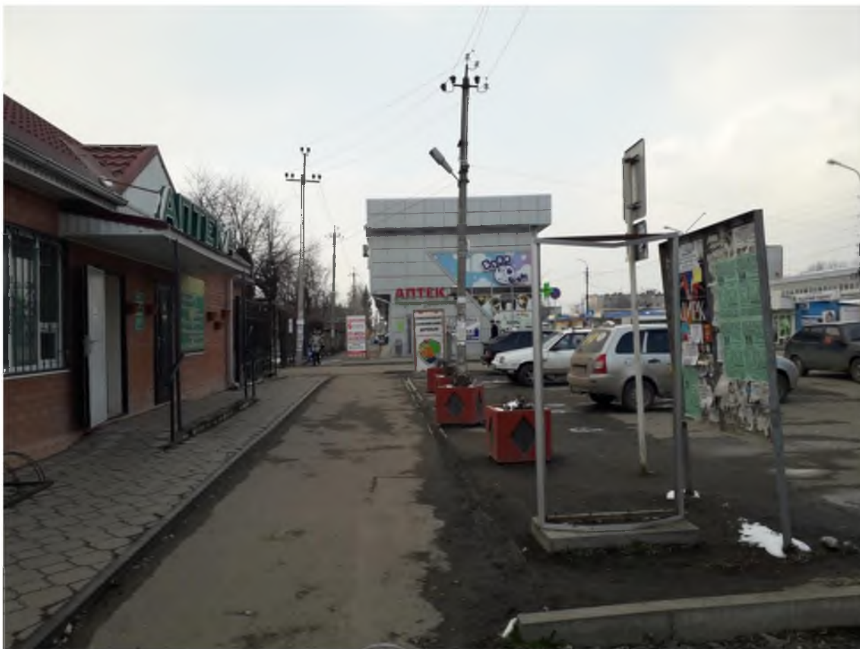
Фотография рекламной конструкции: